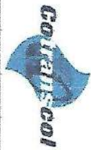
TABLA DE RETENCIÓN DOCUMENTAL